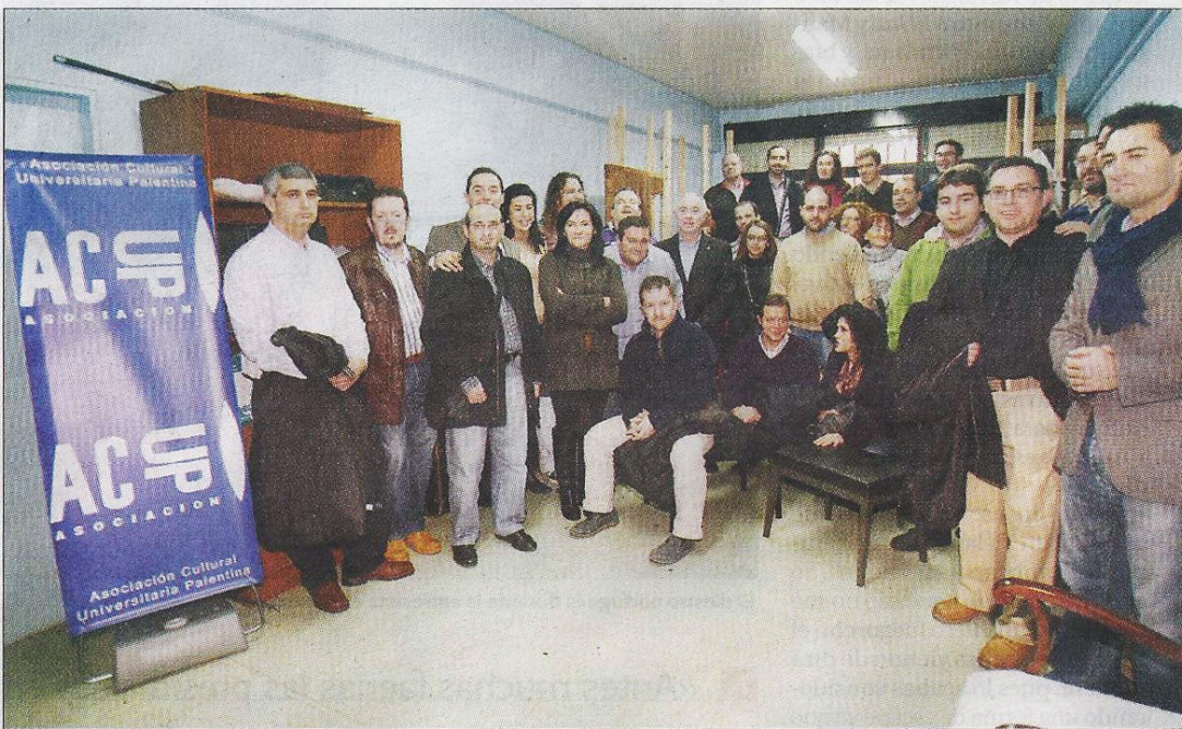
'ACUP' reunió ayer a los directivos de sus 25 años de trayectoria.

Asimismo cabe señalar que el Grupo de Fotografía de ACUP organizó ayer un taller sobre astrofotografía en el que se vieron los fundamentos básicos para poder fotografiar estrellas y alguna noticia sobre fotografía nocturna.